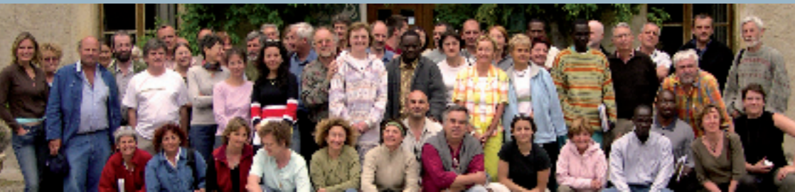
Un réseau Nord / Sud

200 bd National, Le Gyptis Bt. N - 13003 Marseille - FRANCE Tél : 00 (33) 4 91 95 63 45 - Fax : 00 (33) 4 91 95 68 05 santesud@wanadoo.fr - www.santesud.org